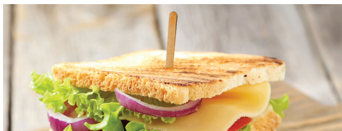
Palillos de Madera para Sándwich