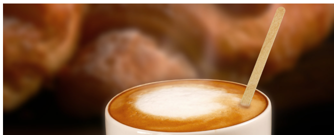
Agitadores de Madera para Café