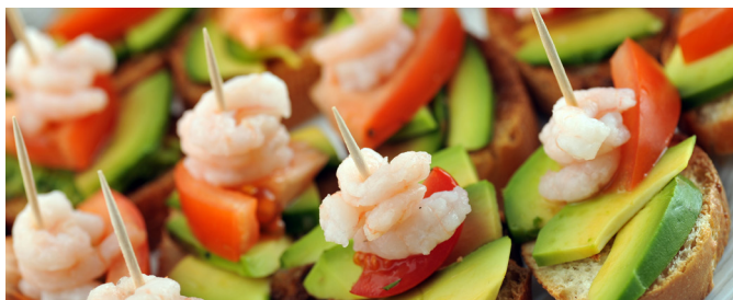
Palillos de Dientes Hechos de Madera

Puedes ofrecer un nuevo aspecto a tus aperitivos, sándwiches, cócteles y más. Nuestros productos auxiliares desechables para servicios de alimentos brindan un aspecto nuevo y fresco, además pueden aumentar la rentabilidad de tus bebidas y/o elementos del menú.